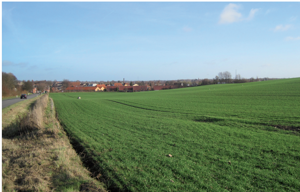
Indkørsel til Præstø fra vest med Antonihøjen i forgrunden